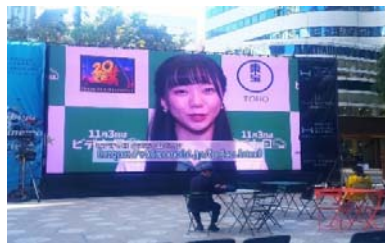
*上映中の『平成から令和へ』2019PV 集