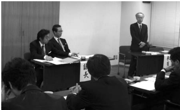
▲総会に先立ち経済産業省大臣官房審議官 吉崎正弘様よりご挨拶を頂戴した。

その他、各分会報告、2009年4月度ビデオソフト売上速報、DVDハード出荷実績等についての報告があった。