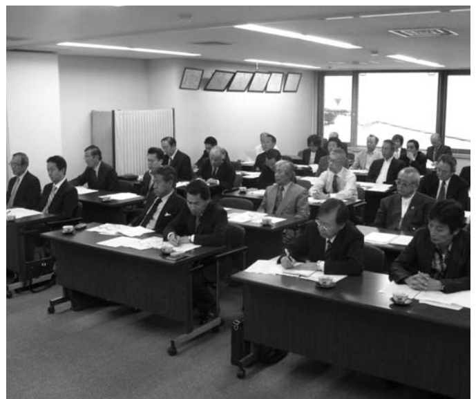
▲総会出席の会員代表者の皆様